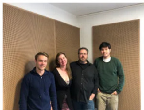
Die Rheinbühne im Interview 🕒 17. April 2018