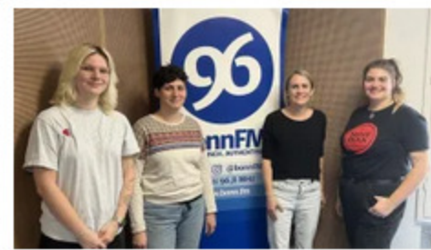
Das MIRA-Filmfestival geht in die nächste Runde 🕒 2. November 2023

Kommentar verfassen. Bitte sei dir bewusst, dass der von dir angegebene Name und die E-Mailadresse nun im Zusammenhang mit deinem Kommentar sichtbar sind.